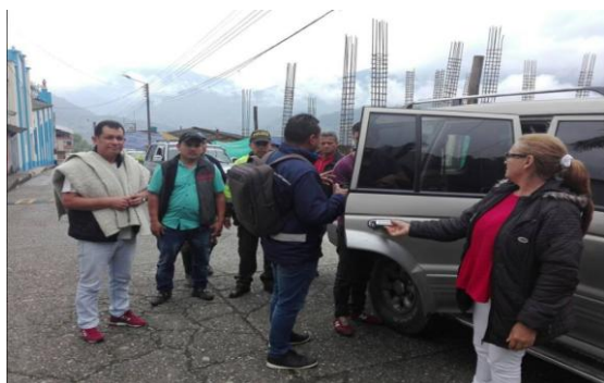
Municipio de Chivor