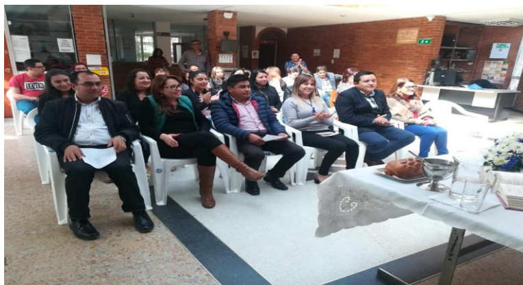
DÍA DE LA MADRE