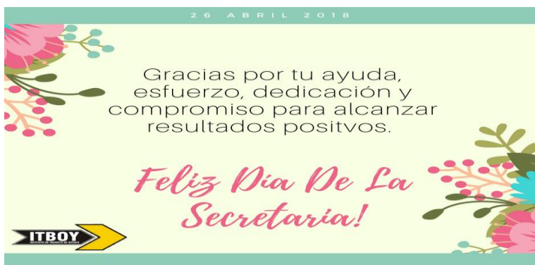
DÍA DE LA SECRETARIA