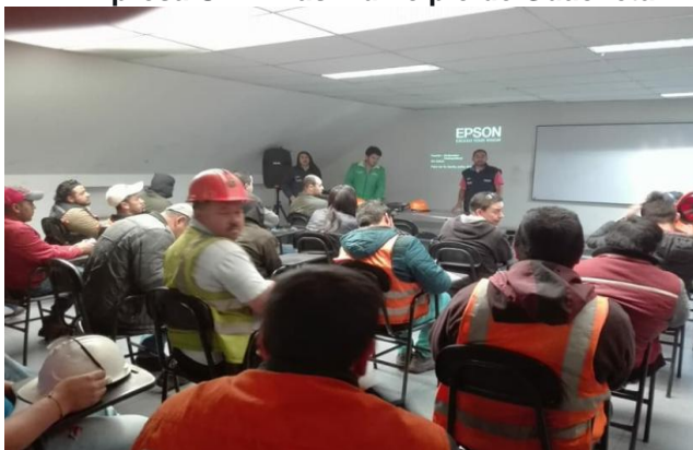
Empresa Uniminas Municipio de Guachetá