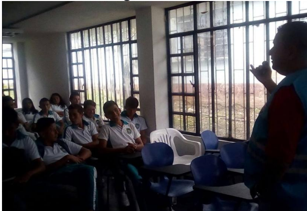
Alcaldía municipio de Moniquirá Rutas Escolares Controladas "Vigías De La Seguridad Vial"