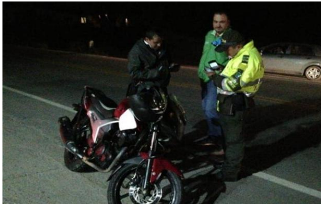
Sector Km 61 de vía Chiquinquirá- Saboyá