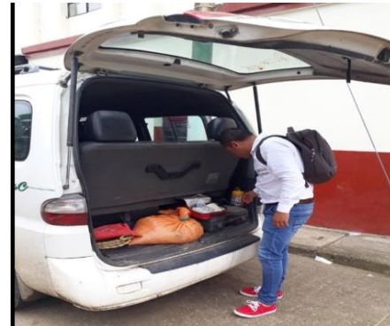
Municipio de Pachavita