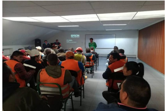
Empresa Uniminas Municipio de Samacá