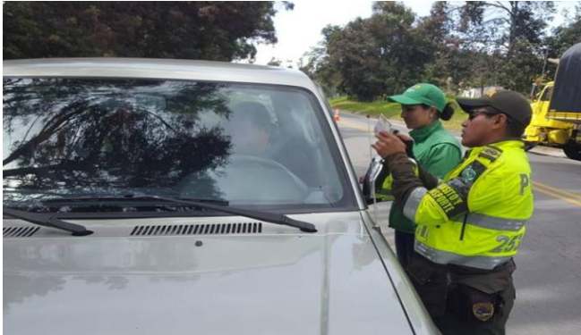
Sector la palestina municipio de Chiquinquirá