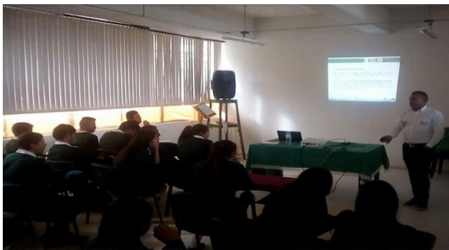
Alcaldía municipio de Güicán Rutas Escolares Controladas "Vigías De La Seguridad Vial"