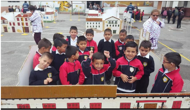
I.E. Técnico Industrial de Tibasosa