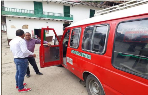
Municipio de Tenza