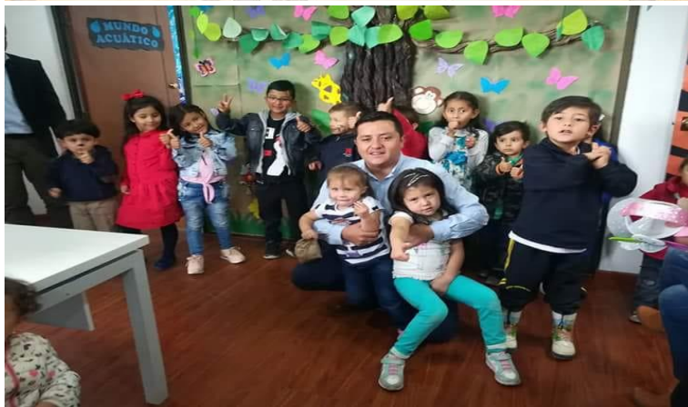
DÍA DEL NIÑO ITBOY