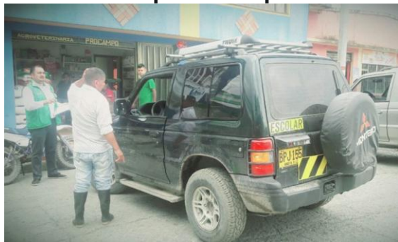
Municipio de Quípama