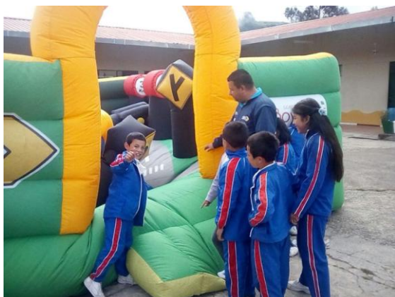
Institución Educativa Agropecuaria Municipio de Úmbita