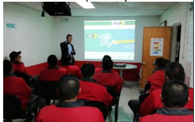
Empresa Envía municipio de Tunja