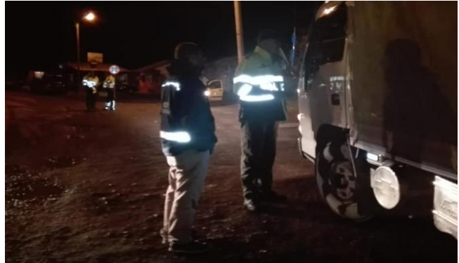
Sector la Raya municipio de Saboya