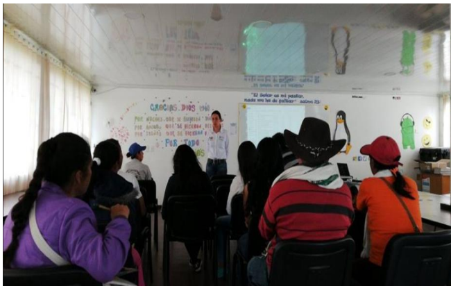
I.E Enrique Suárez (Escuela de padres) municipio de Almeida